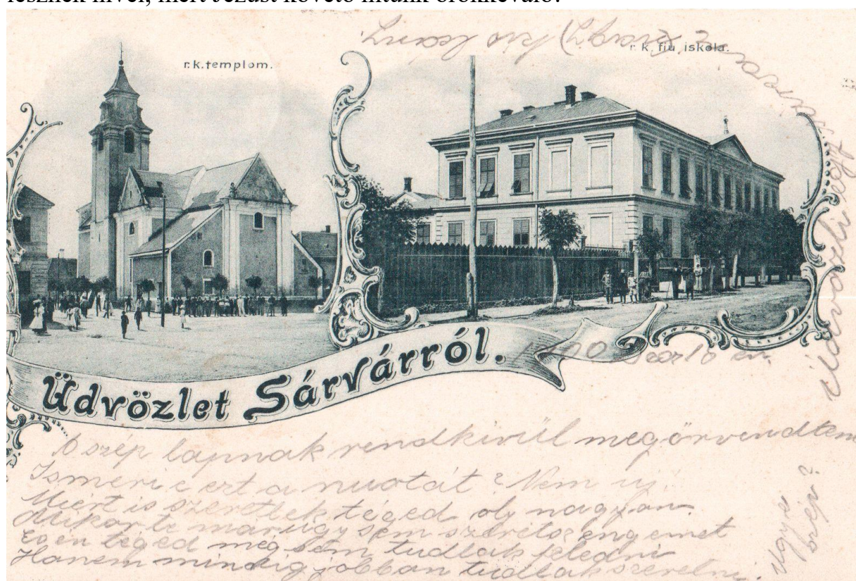
Az iskola avató ünnepség két helyszíne: a Szent László templom és az új iskolaépület egy a XIX-XX. század fordulóján kiadott képeslapon