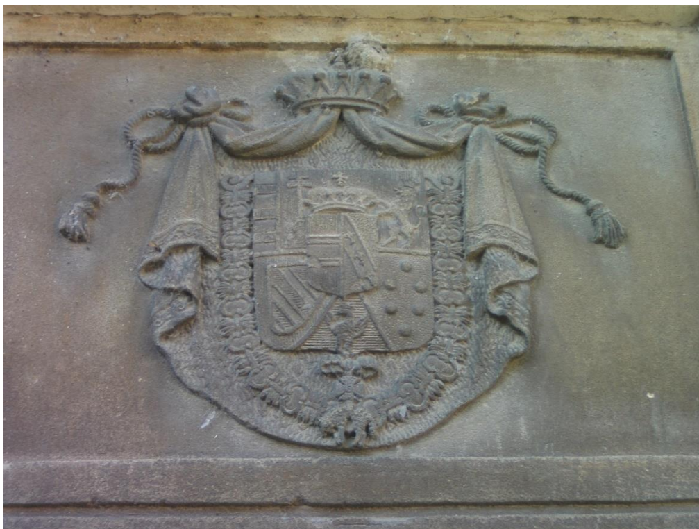
A Habsburg-Estei család címere a Nádasdy-vár udvarán elhelyezett emléktáblán

1803 fontos dátum a család történetében. Ez évben meghalt III. Ercole Rinaldo, akivel az Este család férfiágon kihalt. Az akkor francia megszállás alatt álló Modenai Hercegséget felesége révén Ferdinánd örökölte. Nem mellesleg ebben az évben Magyarországon birtokra tett szert. Habsburg Ferdinánd Szily Józseftől megvásárolta a sárvári uradalmat. Sárvár története ezzel fordulópontjához érkezett.