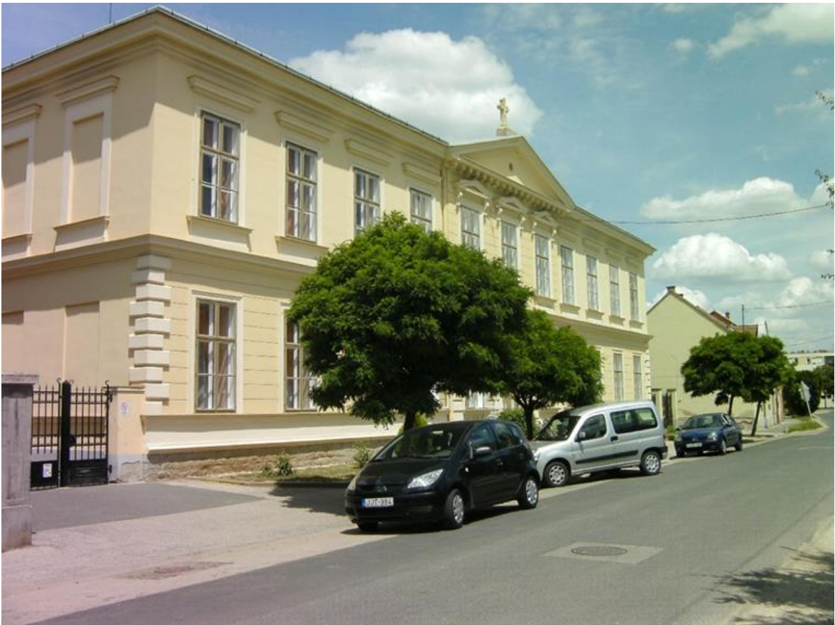
Az 1889-ben épült egykori római katolikus elemi fiú népiskola épülete. Napjainkban - 1996-tól - Szent László Katolikus Általános Iskola működik falai között