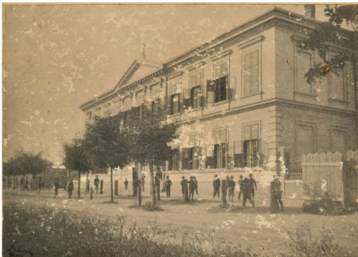
Az iskola épülete 1895-ben készült fotón